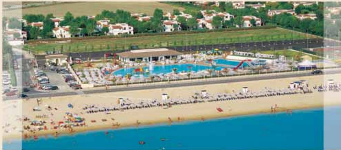
■ Panoramica del villaggio e del parco acquatico Malibù Beach