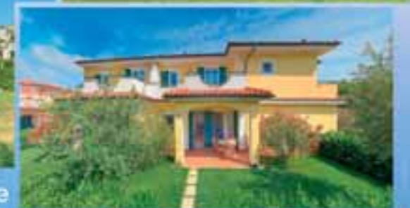
i Giardini del Conero Residence