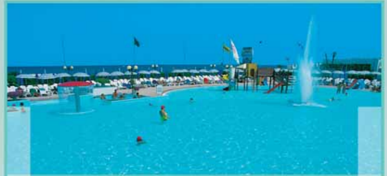
■ Malibù Parco acquatico