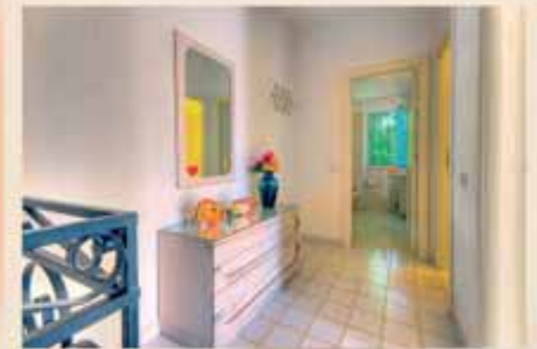
■ Bagno con doccia