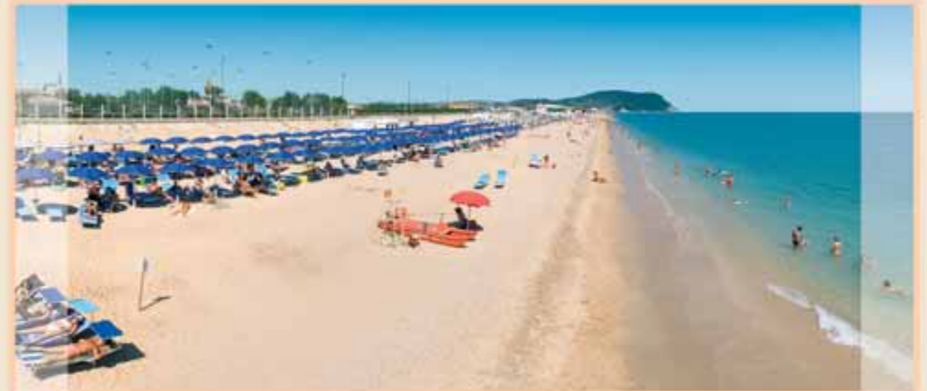
■ Spiaggia: privata (sabbia e ghiaino) attrezzata con ombrelloni, sdraio, lettini e ristorante.