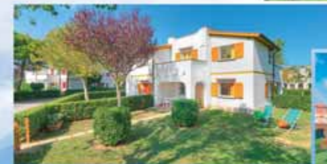
Riva Musone Villaggio Residenziale