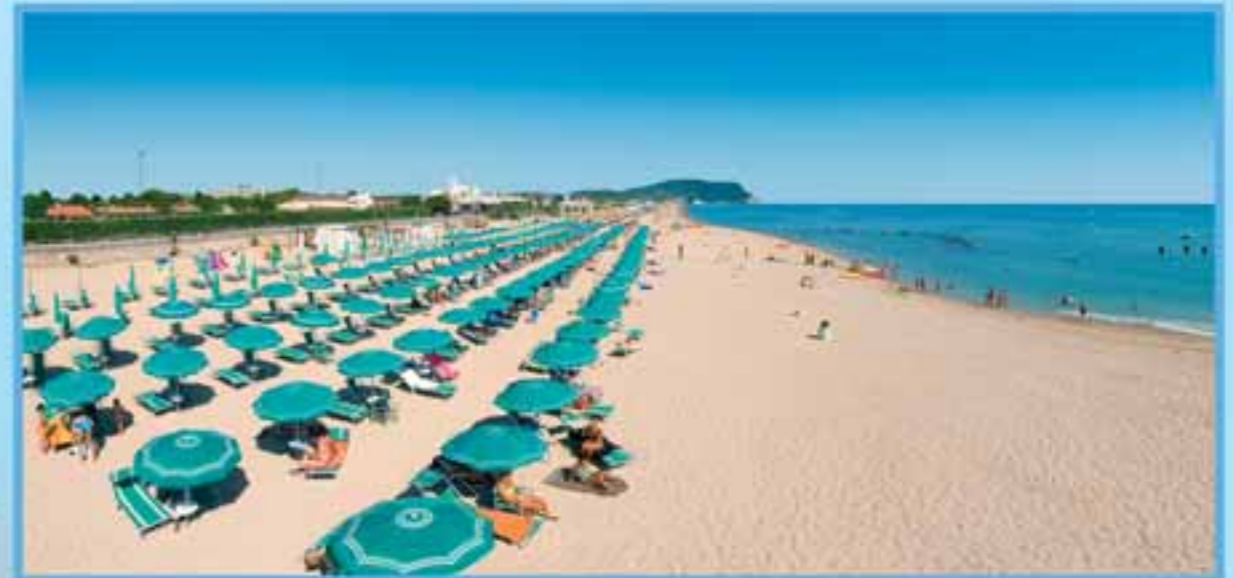
Spiaggia: privata (sabbia e ghiaino) attrezzata con ombrelloni, sdraio e lettini. ■