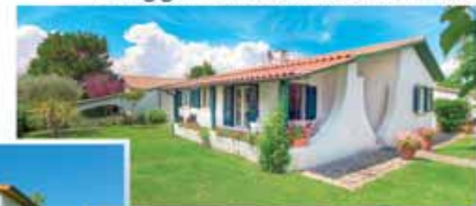
Villaggio Turistico Internazionale

Vacanze al villaggio vuol dire mare . . . senza problemi, vuol dire sentirsi . . . a casa propria